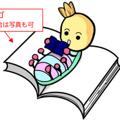
生駒ビブリアオ倶楽部マスコットキャラクター ほんのむしくん